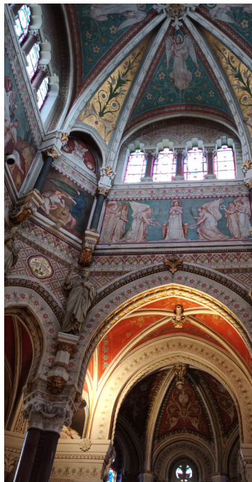
Basilique-Sainte-Philomène, Ars-sur-Formans (Ain), 1862

Professeur d'histoire de l'architecture à l'École nationale supérieure d'architecture de Lyon, spécialiste des 19 e et 20 e siècles.