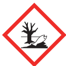
Dangereux pour l'environnement