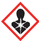
Sensibilisant mutagène, cancérogène reprotoxique