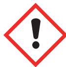
Toxique irritant, sensibilisant narcotique