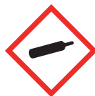
Gaz sous pression