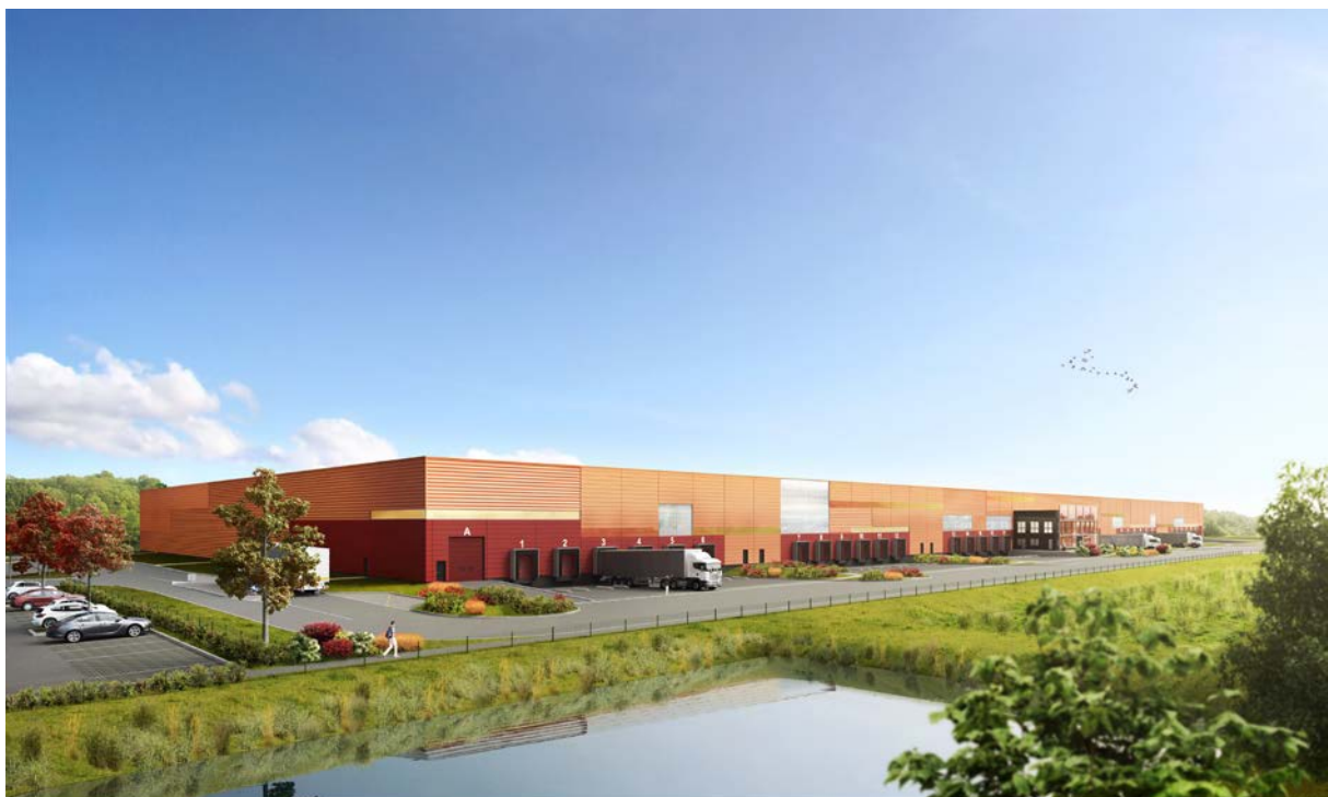
Projet de plateforme logistique de 35 000 m 2 en façade autoroutière © Les Ateliers 4+ - Agence de Lyon

Le 21 septembre dernier, l'opérateur immobilier STAM Europe et un investisseur Nord-américain achetaient un terrain de 79 400 m 2 situé au sein du Parc des Caires à Etoile-sur-Rhône. Aujourd'hui, les investisseurs y construisent une plateforme logistique en façade autoroutière , pour un investissement de 20 millions d'euros (bâti et foncier compris). Ce bâtiment de dernière génération comprendra 6 cellules d'entreposage, des bureaux d'accompagnement et des locaux de charges. Il bénéficiera d'un arrêté préfectoral permettant le stockage d'une large variété de matières combustibles. Les travaux, réalisés par Percier Réalisation et Développement (PRD), devraient s'achever d'ici la fin du mois de novembre 2018 .