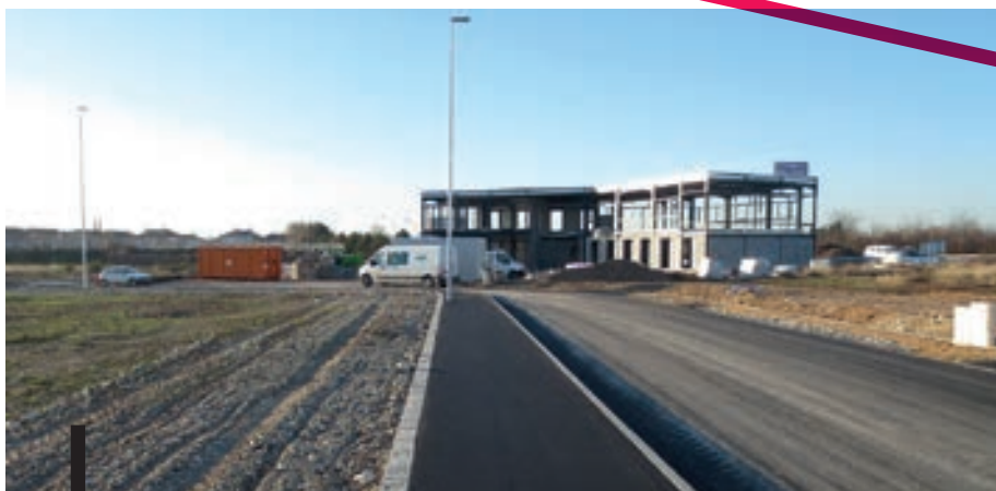
À MORLON, LE BÂTIMENT DE L'ENTREPRISE ADS PROTECTION EST LE PREMIER À SORTIR DE TERRE.

prises et de start-up à fort développement. On estime ainsi que plus de 500 nouveaux postes seront créés en 2019.