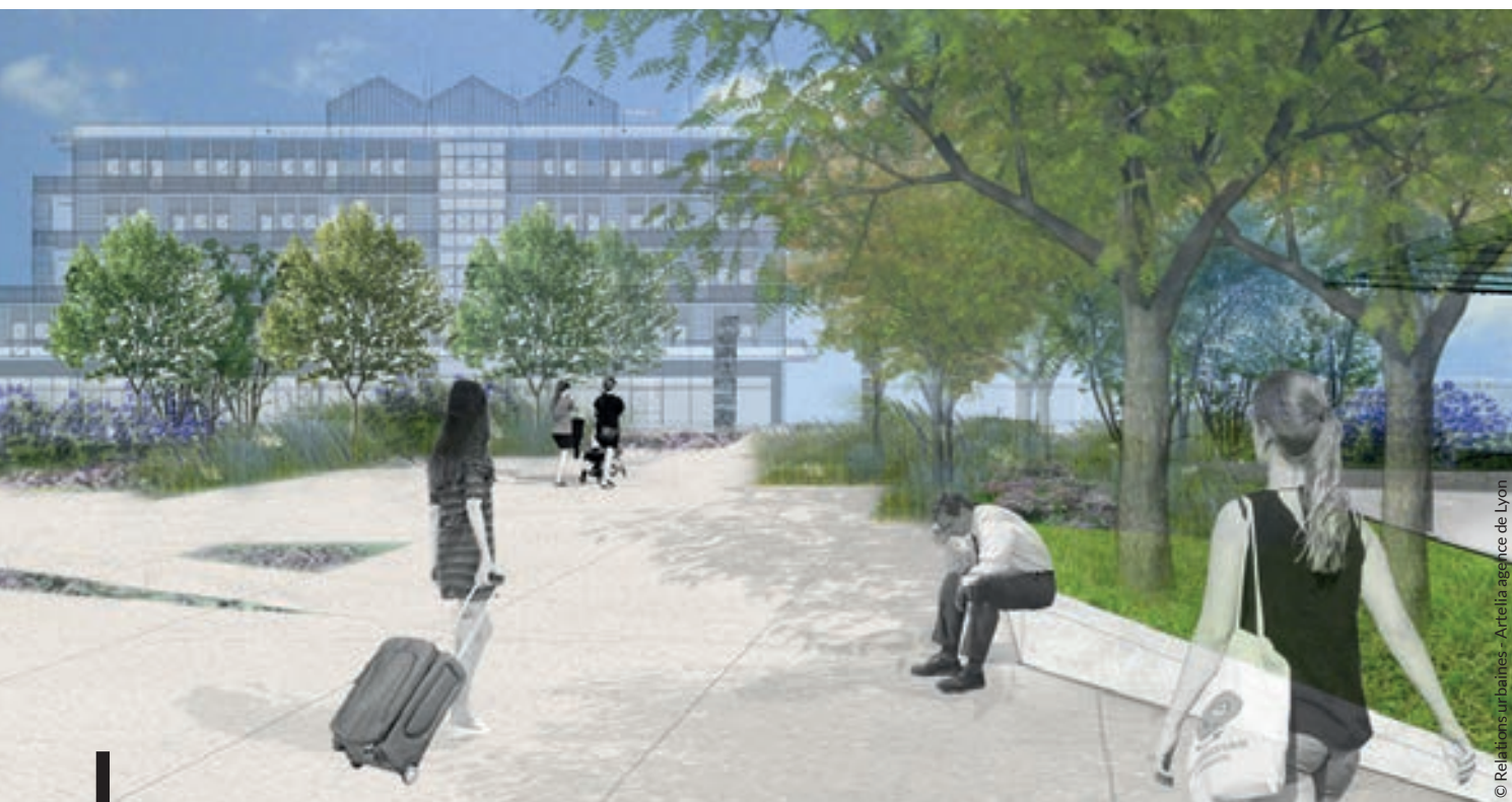
© Relations urbaines - Artelia agence de Lyon

Au total, plus de 2 100 personnes travaillent quotidiennement à Rovaltain. Ce chiffre devrait gonfler de manière significative avec l'installation de grandes entre-