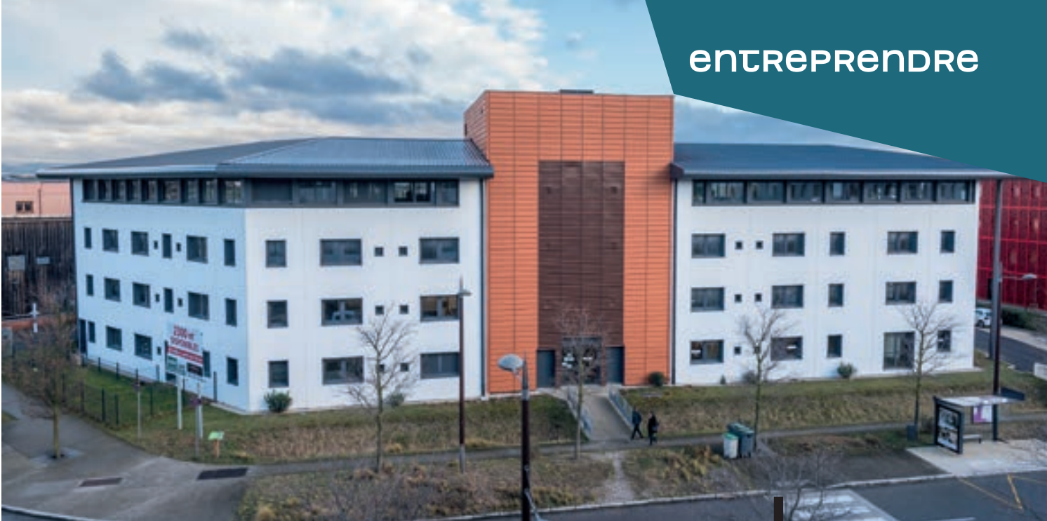
LE BÂTIMENT GALILÉE ACCUEILLE LE SIÈGE SOCIAL DE CHARLES & ALICE