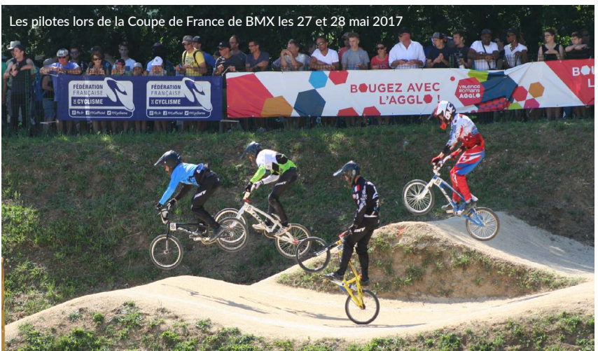
Les pilotes lors de la Coupe de France de BMX les 27 et 28 mai 2017

Enfin, le 3 e projet consistait à la réhabilitation de la salle des fêtes : mise aux normes de la toiture, réfection de l'éclairage et de la sonorisation et mise en accessibilité de l'équipement pour les personnes handicapées. À Mours-Saint-Eusèbe, la municipalité a mis à profit la totalité de son enveloppe « Fonds de concours » allouée par l'Agglo pour ces équipements structurants et le bien-vivre ensemble.