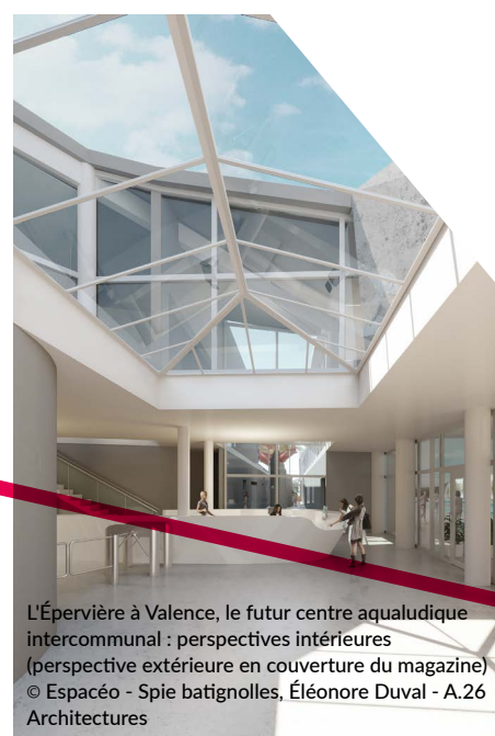
L'Épervière à Valence, le futur centre aquatique intercommunal : perspectives intérieures (perspective extérieure en couverture du magazine) © Espacéo - Spie batignolles, Éléonore Duval - A.26 Architectures