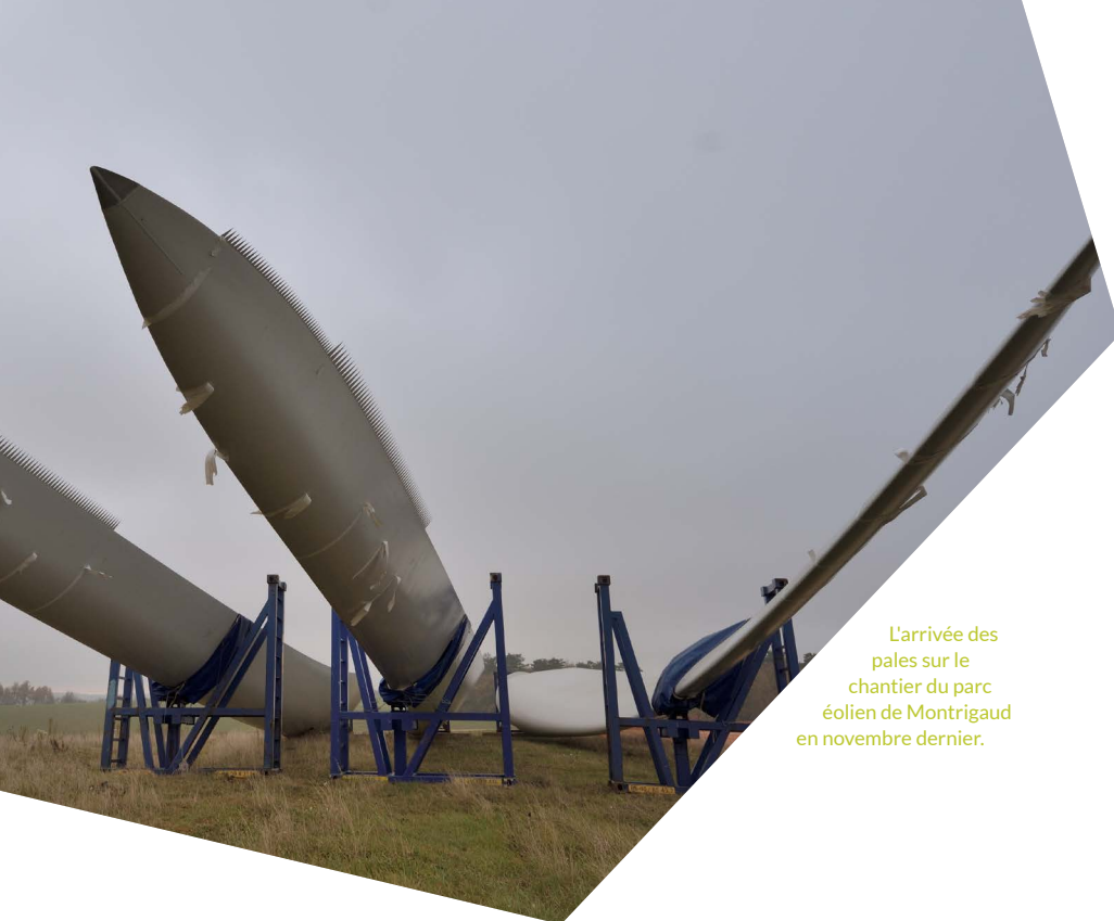
L'arrivée des pales sur le chantier du parc éolien de Montrigaud en novembre dernier.