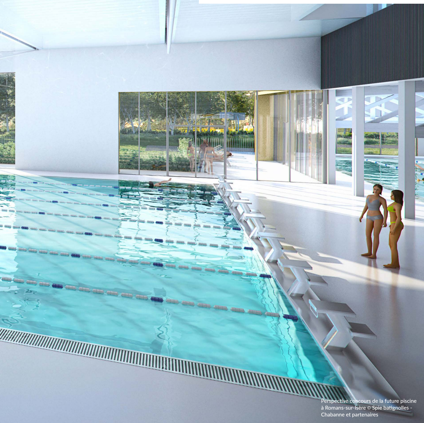
Perspective concours de la future piscine à Romans-sur-Isère © Spie batignolles - Chabanne et partenaires

La Communauté d'agglomération se démarque avec la création de quatre projets de sport et loisirs aquatiques d'ici à 2020. Destinées à offrir des équipements de qualité aux habitants, ces réalisations seront également un atout très important pour le rayonnement du territoire et son attractivité touristique.