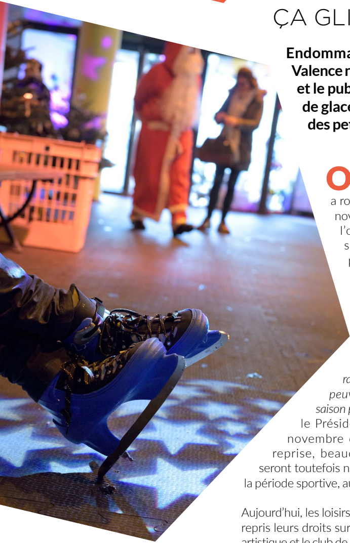
Noël à la patinoire du 16 décembre au 7 janvier, animations maquillage, friandises et visites du Père Noël et du lutin !

Endommagée par un incendie cet été, la patinoire intercommunale à Valence n'avait pas pu démarrer sa saison pénalisant les clubs, les scolaires et le public. Après trois mois de travaux, l'équipement a rouvert sa piste de glace, mi-novembre. Pendant les fêtes, la patinoire a fait le bonheur des petits et propose de nouveaux rendez-vous jusqu'au printemps !