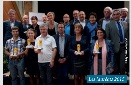
Les lauréats 2015

+ d'infos : contact@tropheesentreprises.fr - 04 75 75 98 54