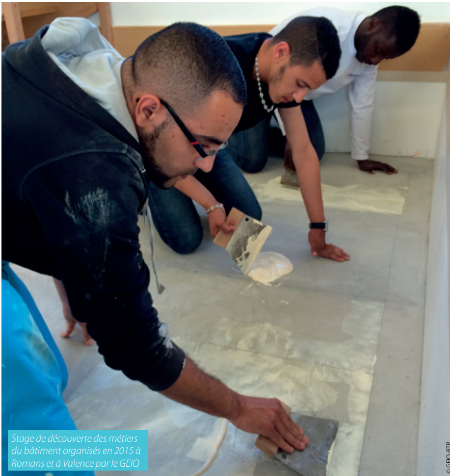
Stage de découverte des métiers du bâtiment organisés en 2015 à Romans et à Valence par le GEIQ

Signé en juillet dernier, le contrat de ville 2015-2020 de la Communauté d'agglomération se concrétise aujourd'hui par la mise en œuvre des premières actions sur le terrain. Elaboré avec les Villes de Valence et de Romans, ce document engage l'Agglo au plus près des quartiers, dans un co-pilotage avec l'État. Cette année, 62 projets en lien avec les quartiers prioritaires bénéficieront d'un soutien financier.