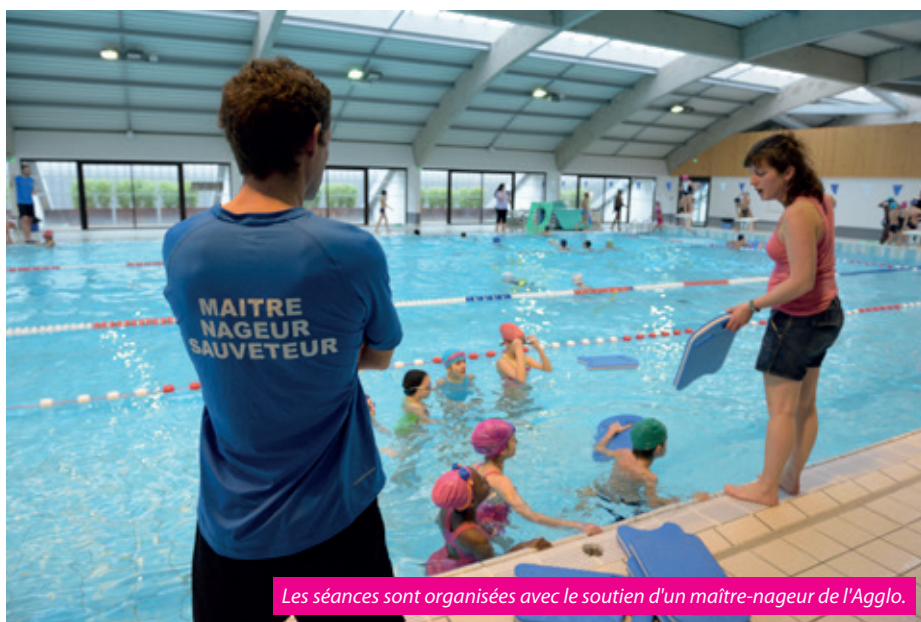
Les séances sont organisées avec le soutien d'un maître-nageur de l'Agglo.

rante-cinq minutes en moyenne, est pilotée par l'enseignant avec le soutien d'un maître-nageur mis à disposition par l'Agglo. Au total, douze agents diplômés interviennent dans les piscines communautaires de Romans-sur-Isère (Caneton),