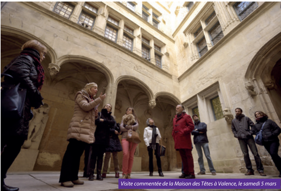
Visite commentée de la Maison des Têtes à Valence, le samedi 5 mars