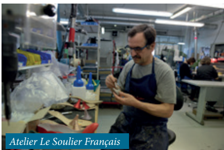
Atelier Le Soulier Français