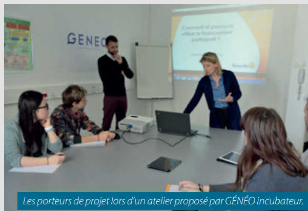
Les porteurs de projet lors d'un atelier proposé par GÉNÉO incubateur.

+ d'infos : Céline Jeanne - dromeardèche@les-entrepreneuriales.fr