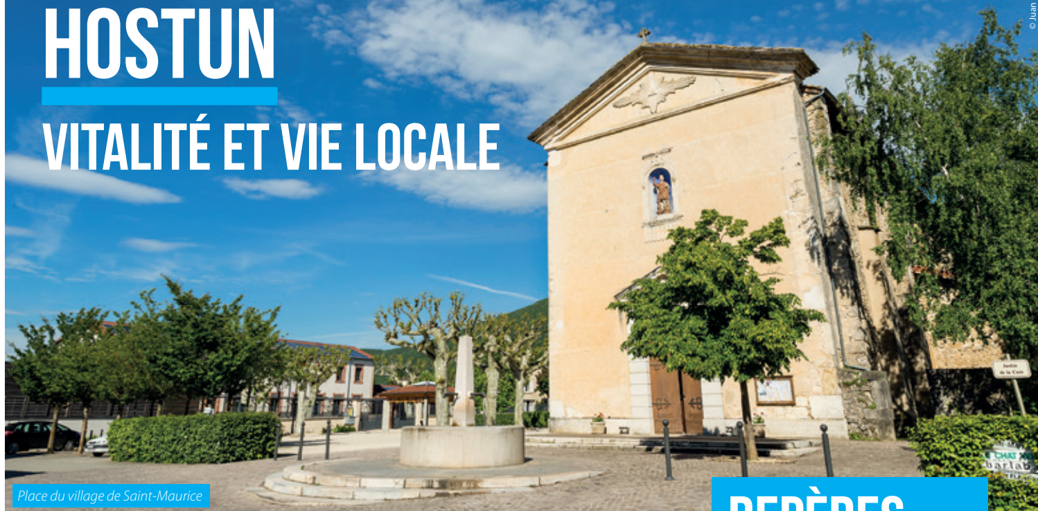
Place du village de Saint-Maurice

AU PIED DES MONTS DU MATIN, À L'EST DE L'AGGLO, HOSTUN EST COMPOSÉ DE DEUX VILLAGES : SAINT-MARTIN ET SAINT-MAURICE. PAYSAGES, PATRIMOINE, NOIX, TOURISME ET VIE ASSOCIATIVE SONT SES ATOUTS !