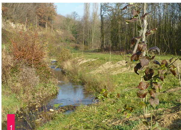
2 - EXEMPLE DE TRAVAUX DE CRÉATION DE BARRAGES - TRAVAUX D'AMÉNAGEMENT CONTRE LES CRUES DE LA SAVASSE (2008)