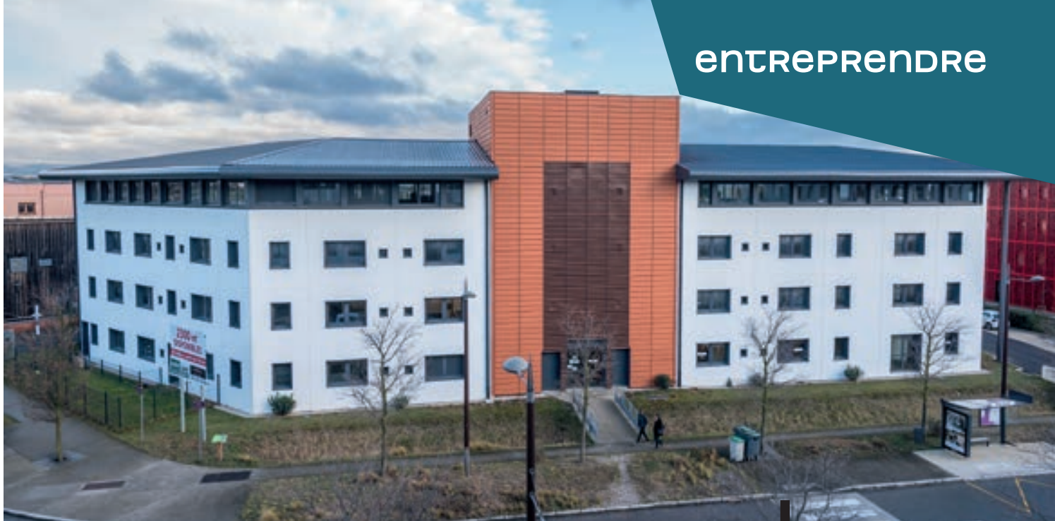
LE BÂTIMENT GALILÉE ACCUEILLE LE SIÈGE SOCIAL DE CHARLES & ALICE