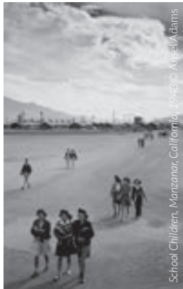
School Children, Manzanar, California, 1940s

Théâtre, cirque, performance, musique... Pour sa 8 e édition, le festival Ambivalence(s) se déploie à La Comédie, au Théâtre de la ville, au musée de Valence et jusqu'à Romans à La Cordonnerie. Découvrez, entre autres, trois créations du Collectif artistique dont Certaines n'avaient jamais vu la mer , mis en scène par Richard Brunel en avant-première de la 72 e édition du Festival d'Avignon.